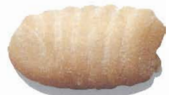
Formato grandezza naturale